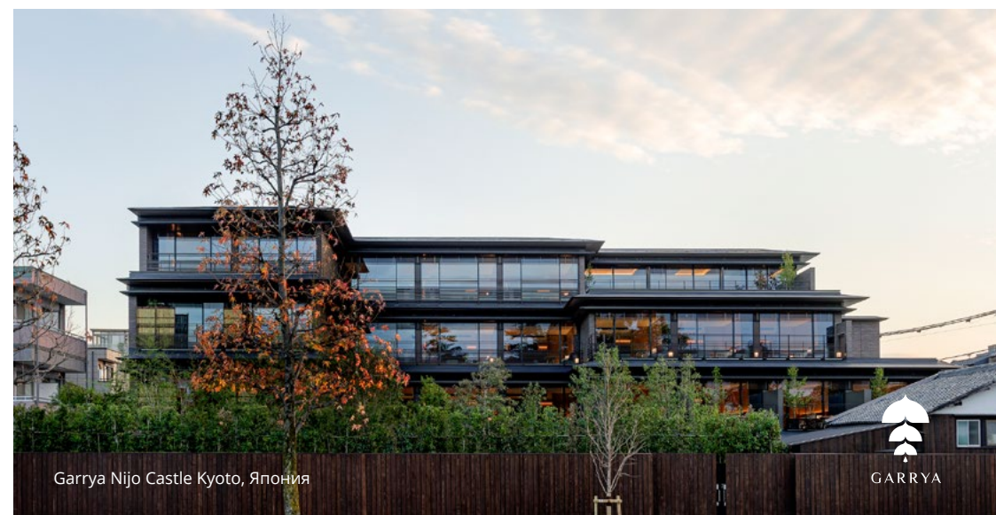
Garrya Nijo Castle Kyoto, Япония