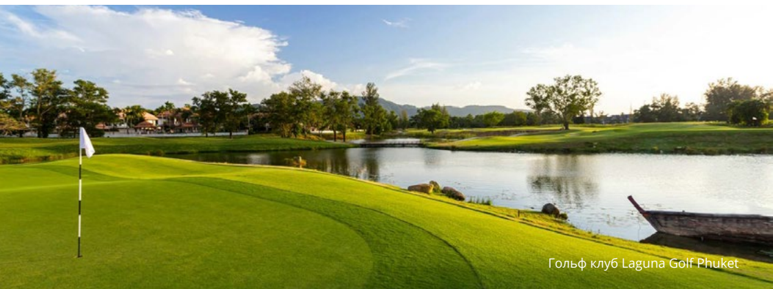
Гольф клуб Laguna Golf Phuket

В дополнение к выбору роскошных спа, пятизвездочных резортов, 18-луночного профессионального гольф-поля Laguna Phuket, разнообразных водных видов спорта и досуговых мероприятий внутри курорта Laguna Phuket, владельцы также находятся в удобном месте для посещения близлежащих развлекательных мест, таких как Boat Avenue и Central Porto de Phuket.