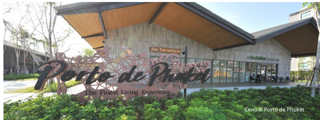
Central Porto de Phuket